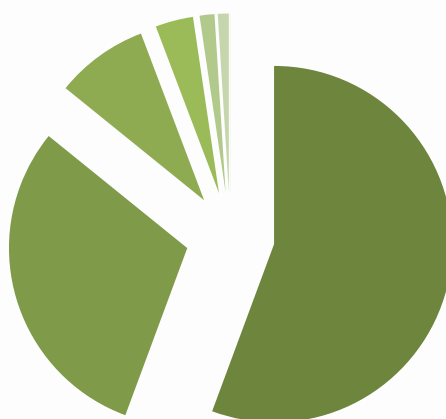
Рис. 1. Структура российского рынка растительных масел, 2021 г., %

Источник: ФТС, Росстат, расчеты NeoAnalytics