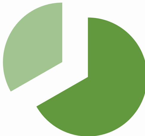
Рис. 1. Структура парка контейнерного парка в России, 2019г., %

Источник: расчеты NeoAnalytics, данные по компаниям